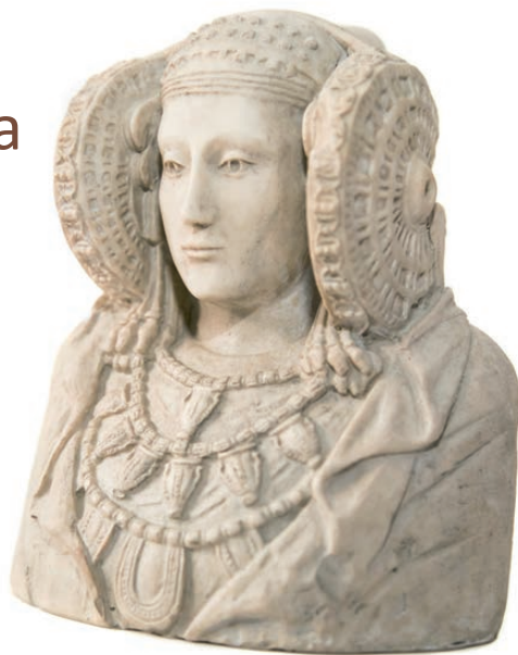
en la Casa de la Cadena.

Las inscripciones deben realizarse en la Casa de la Cadena, del 8 al 17 de octubre, de lunes a viernes, del día 8 al 11 de octubre, de 15:00 a 20:00 horas y del 11 al 17, de 11:30 a 19:00 horas. Si la demanda supera las plazas ofertadas se realizará un sorteo público el día 18 de octubre, a las 12:00 h