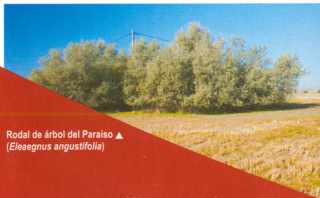
Rodal de árbol del Paraíso ▲ ( Elaeagnus angustifolia )

Es un árbol muy resistente a la sequía y a los suelos pobres, como los yesosos de esta zona. Además se puede usar para setos y como cortavientos, y es capaz de fijar el nitrógeno atmosférico gracias a unos nódulos de sus raíces. Es originario del sur y centro de Asia. En Pinto los encontramos plantados o naturalizados cerca de los caminos, como en las inmediaciones de la casa de Gótzquez de Arriba y en la Cañada Real Galiana a la altura del polígono Las Arenas, dentro del Parque Regional. Muy cerca de Pinto hay que destacar el interesante bosque asilvestrado que hay en el parque Bolitas del Airón, de Valdemoro.