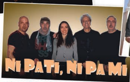
NI PA TI, NI PA MI