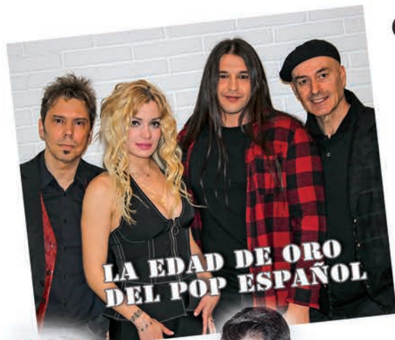
LA EDAD DE ORO DEL POP ESPAÑOL