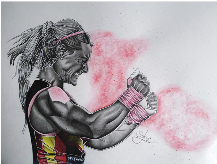
Gloria eterna (Lydia Valentín) Lápices de grafito, de colores, rotuladores y ceras acuarelables. 29,7 x 42 cm.