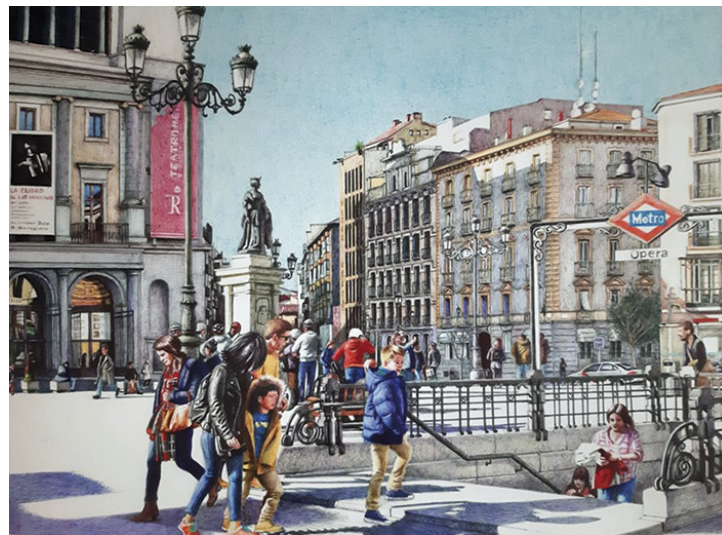
Plaza de Ópera Bolígrafos de colores sobre cartulina 30 x 40 cm.