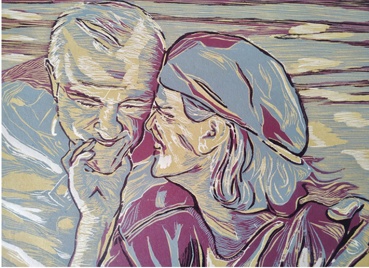
Abuelos, cuando prevalece el cariño