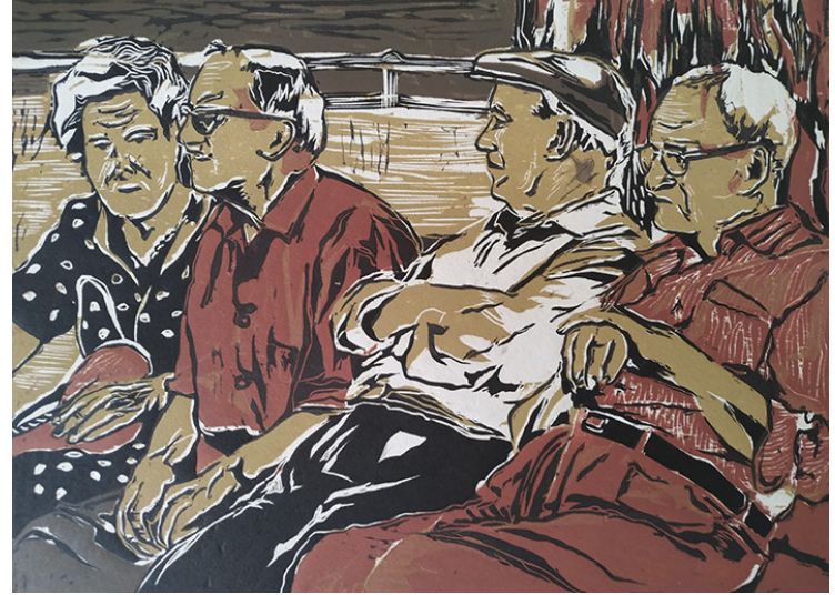
Abuelos, merecido descanso