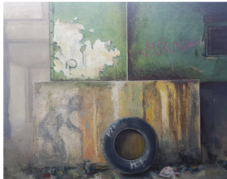
El hombre de Vitruvio Óleo sobre tabla entelada 110 x 80 cm.