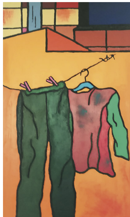
Ropa en la cuerda Óleo sobre tela 116 x 73 cm.