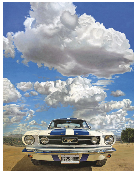
Ford Mustang Óleo sobre tabla. 125 x 90 cm.