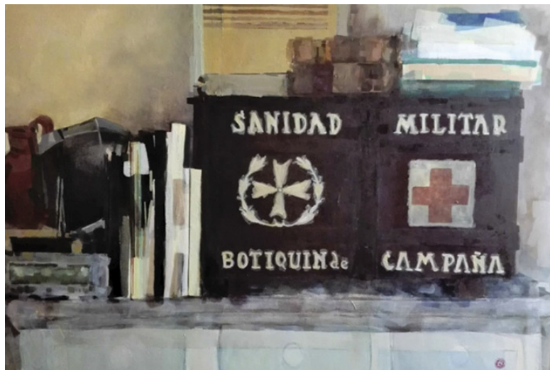
Elementos y arcón Óleo sobre tela 68 x 100 cm.