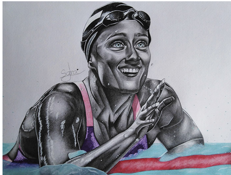
La triple corona (Mireia Belmonte) Lápices de grafito, de colores, rotuladores y ceras acuarelables. 23,8 x 31,8 cm.