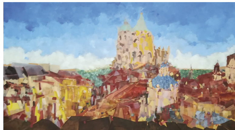
Vista de Teruel desde el Museo Provincial Óleo sobre tela 80 x 150 cm.