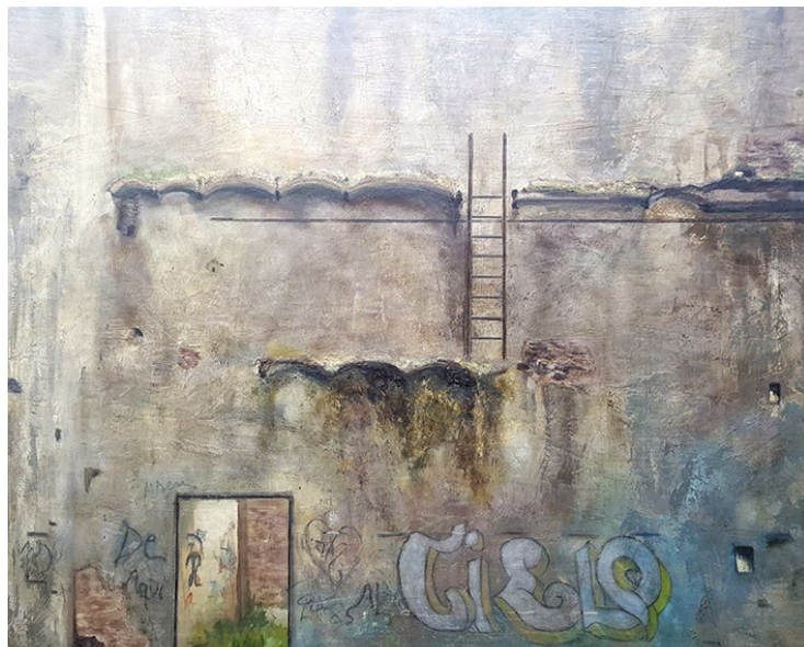
De aquí al cielo Óleo sobre tabla 122 x 81 cm.