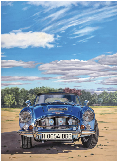
Austin Healey MkIII 3000 Óleo sobre tabla. 118 x 80 cm.