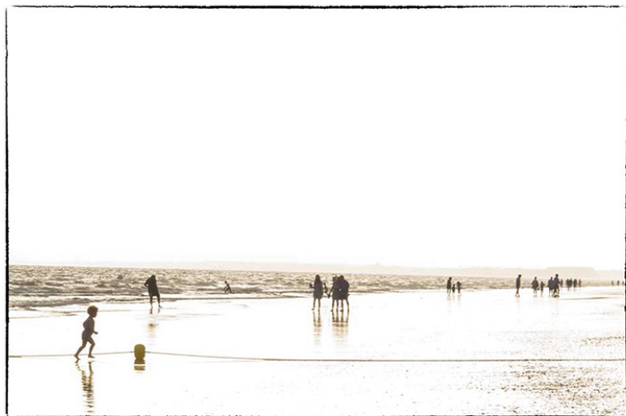
Punta Umbría I Fotografía digital 21 x 30 cm.