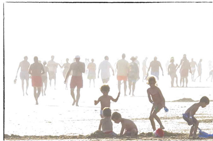
Punta Umbría II Fotografía digital 21 x 30 cm.