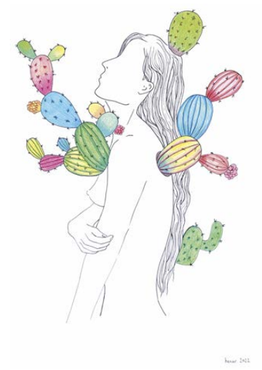
Espinas II Técnica mixta: rotulador, lápices de colores, collage sobre cartón pluma. 42 x 29,7 cm.