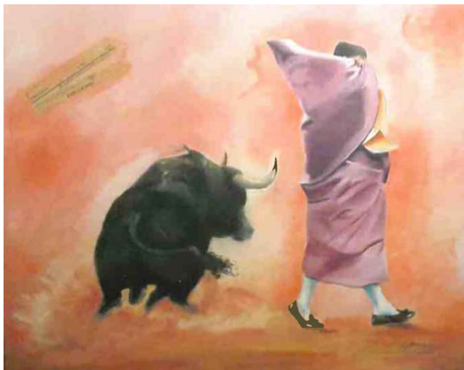
Quite de sudario Óleo 100 x 50 cm.