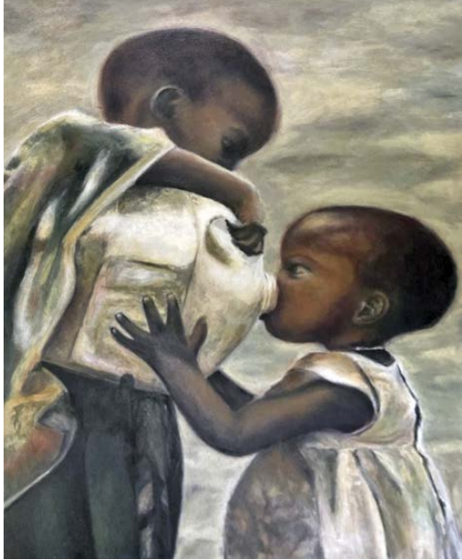
Sin título 90 x 60 cm.