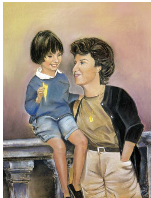
Madre e hija Pastel 50 x 70 cm.