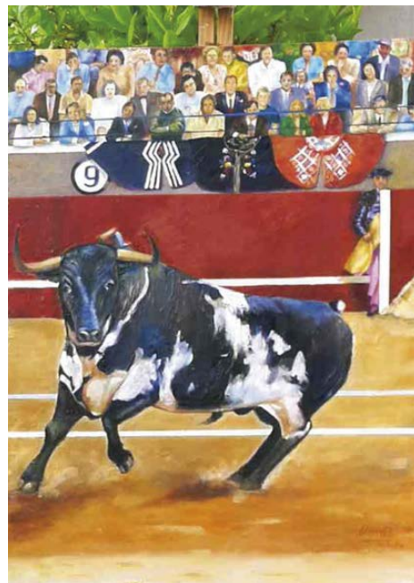
Sin título Óleo 40 x 30 cm.