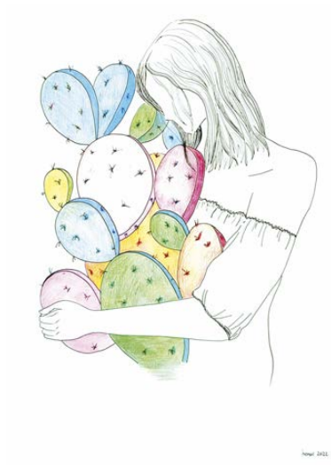
Espinas I Técnica mixta: rotulador, lápices de colores, collage sobre cartón pluma. 42 x 29,7 cm.