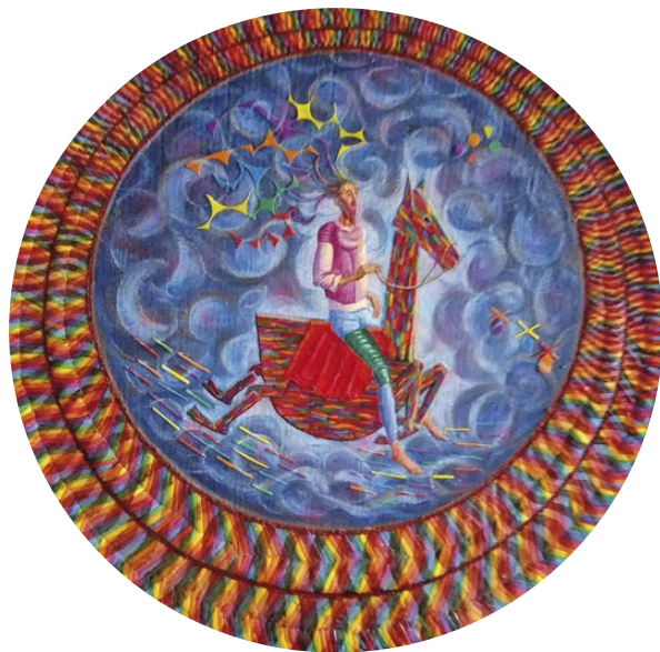
Clavileño Collage 90 cm.