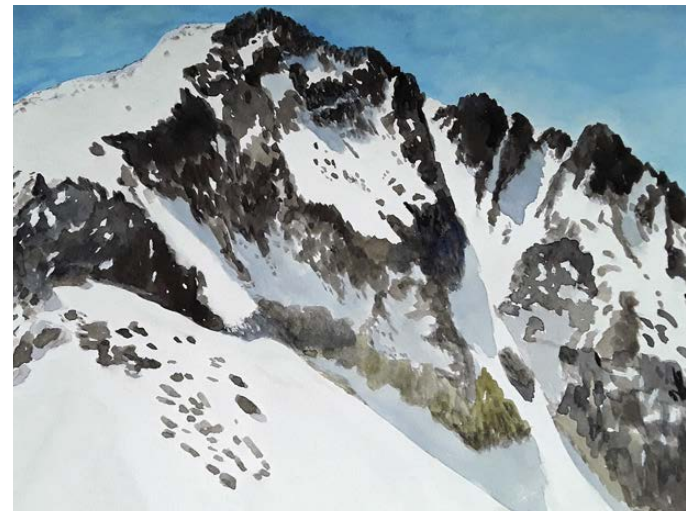
Corredor de Estasen. 3.179 m. (Pirineos. Huesca) Acuarela 42 x 30 cm.