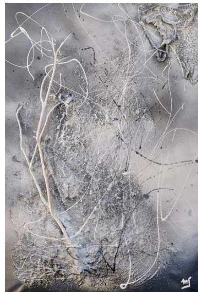
White branch Técnica mixta sobre lienzo 90 x 61 cm.