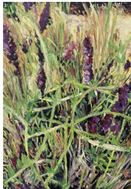
Sin título 100 x 50 cm.