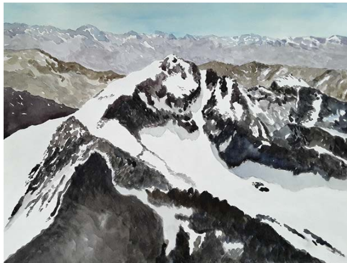
Pico Aneto. 3.404 m. (Pirineos. Huesca) Acuarela 42 x 30 cm.