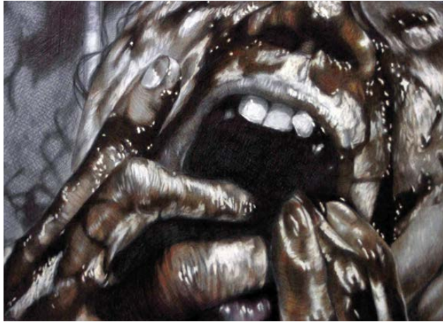
Dolor Bolígrafo sobre papel 50 x 30 cm.