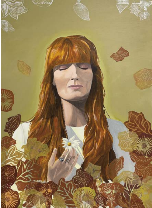
Florence natura Acrílico y collage sobre lienzo 65x90cm.