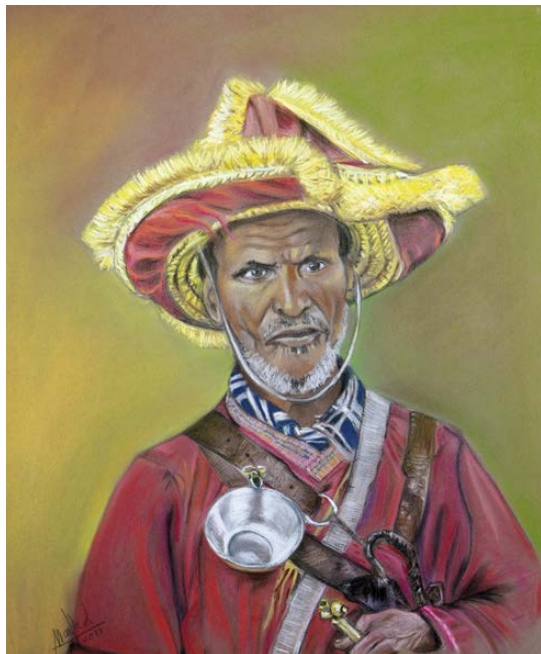
Aguador marroquí Pastel 50 x 70 cm.