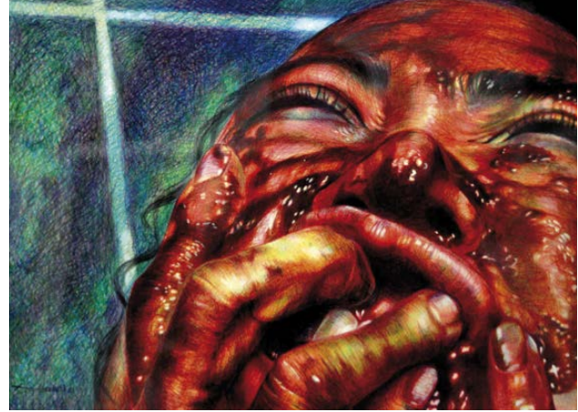
Dolor 2 Bolígrafo sobre papel 50 x 30 cm.