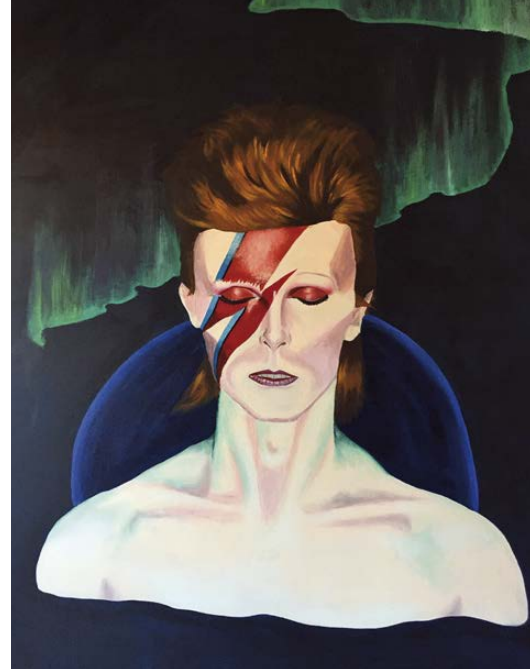
Bowie caelum Acrílico sobre lienzo 70x90cm.