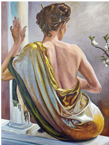
Sin título 80 x 60 cm.