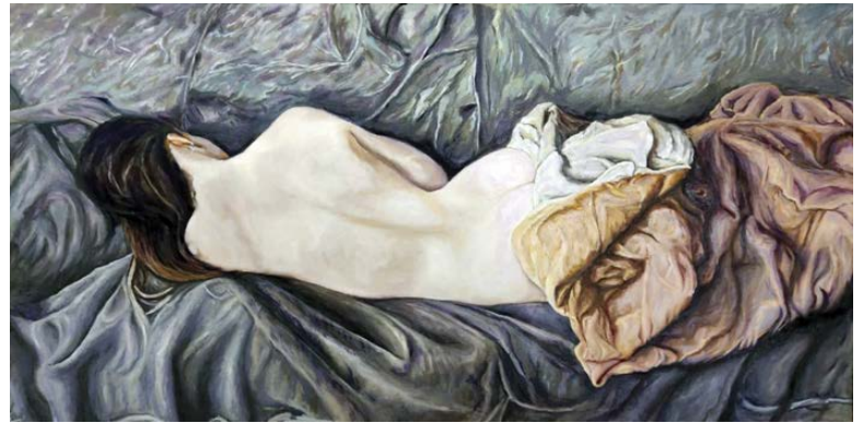
Sin título 70 x 50 cm.