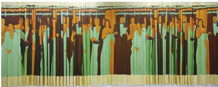
Personajes de cortina Óleo sobre tabla 2 m x 90 cm.