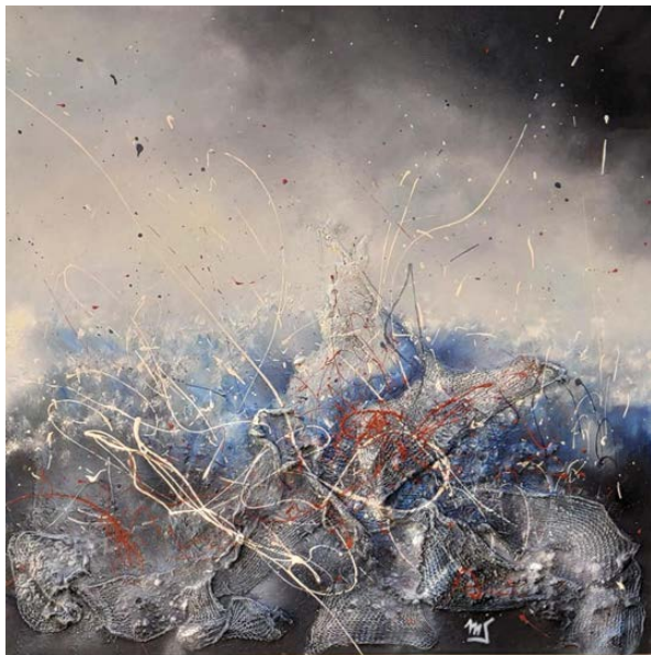
Tempestad Técnica mixta sobre lienzo 80 x 80 cm.