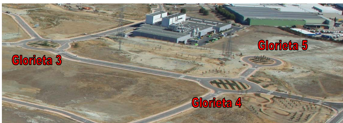
Figura. Fotografía aérea del Sector 4 durante la fase de obras de urbanización

En cuanto a la reducción de 5.539 m 2 de la franja de Espacios Libres Arbolados que computaba como Red Local de Espacios Libres Arbolados, el Plan Parcial reservaba un total de 27.782 m 2 , que superaba en 1.730 m 2 la mínima establecida. Por tanto, de la reducción que se plantea de 5.539 m 2 , 1.730 m 2 ya se compensan con el remanente que existía, y sólo faltarían por reubicar 3.809 m 2 . Para ello es necesario modificar la calificación de las isletas interiores de las glorietas del Sector (glorieta 3, glorietta 4 y glorietta 5) a Espacio Libre Arbolado, dado que la urbanización que se ha ejecutado en estas isletas es la propia de Espacio Libre, tal y como se comprueba en las siguientes fotografías de estas glorietas, tomadas durante la fase de las obras de urbanización del Sector: