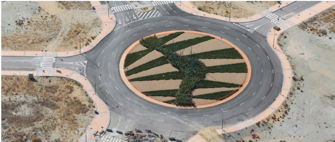
Figura. Fotografía aérea en detalle de la Glorieta 4 durante la fase de obras de urbanización

Estas isletas tienen un diámetro de 50 m en las glorietas 3 y 4 y de 36 m en la glorieta 5, y cuentan con una superficie de 1.963 m 2 en las glorietas 3 y 4, y 1.018 m 2 en la glorieta 5, por lo que pueden computarse como Espacios Libres Locales, al ser poder inscribirse en ellos un círculo de 30 m. y contar con una superficie superior a 1.000 m 2 (Artículo 4 del Anexo del Real Decreto 2159/1978, de 23 de junio (Reglamento de Planeamiento de 1978)).