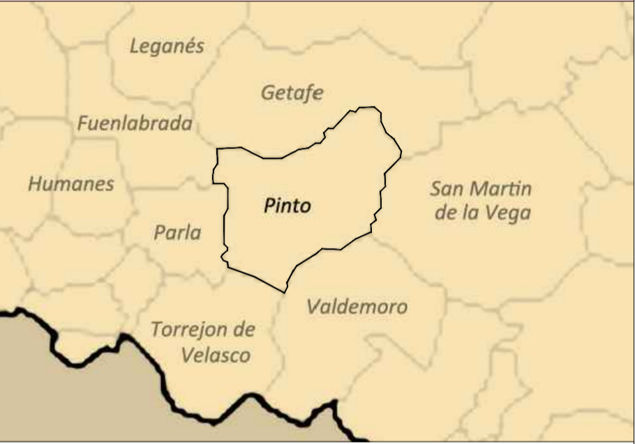
Emplazamiento del ámbito. TM Pinto. S/E