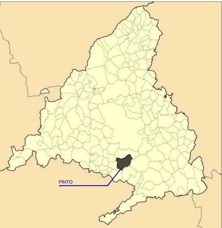
TM Pinto. Comunidad de Madrid. S/E